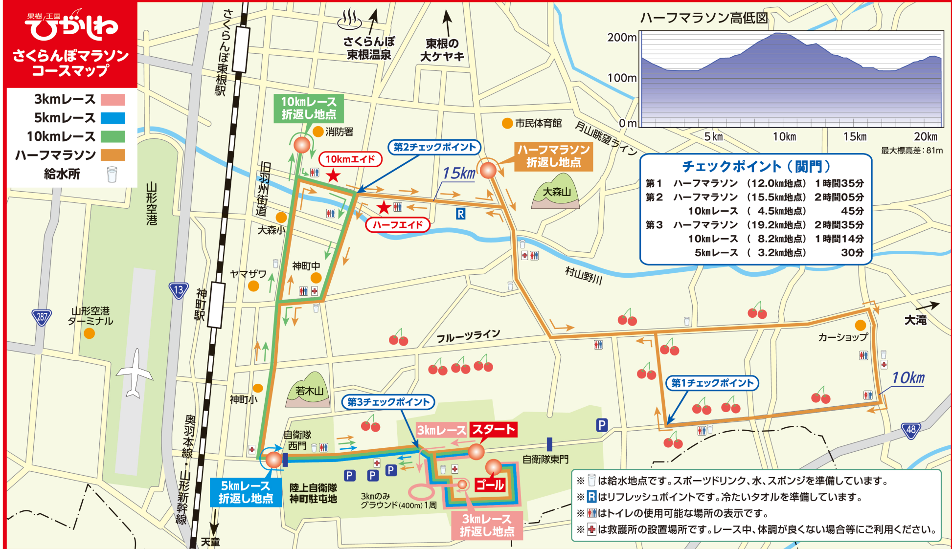
ハーフマラソン高低図